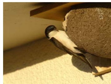
Hirondelle de fenêtre sur nichoir artificiel

La Boutique LPO propose à la vente des planchettes en bois et des nichoirs artificiels destinés à cet usage, que l'on peut retrouver sur : https://boutique.lpo.fr