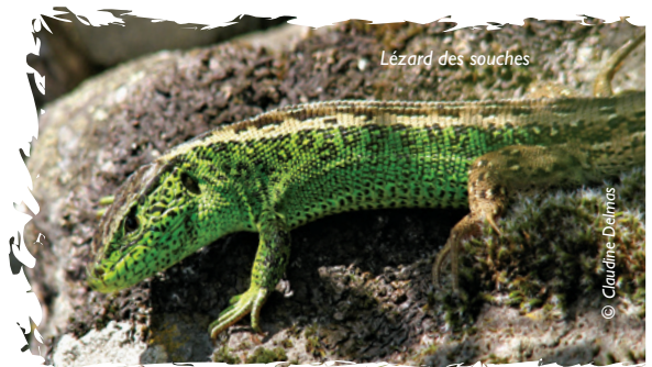
Lézard des souches