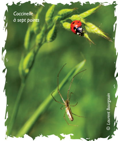
Coccinelle à sept points