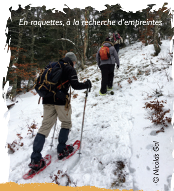
En raquettes, à la recherche d'empreintes