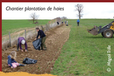
Chantier plantation de haies